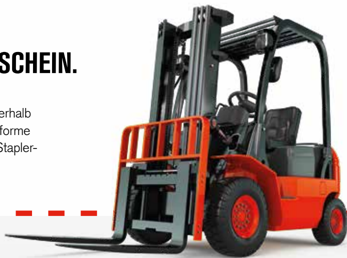
Staplerkurse in Tirol mit Partner Pfitscher Staplertechnik.

Mit umfassendem Praxisanteil holen Sie sich innerhalb von 2 Tagen alle Kenntnisse für die gesetzeskonforme Inbetriebnahme und Bedienung aller möglichen Staplertypen und legen die entsprechende Prüfung ab.